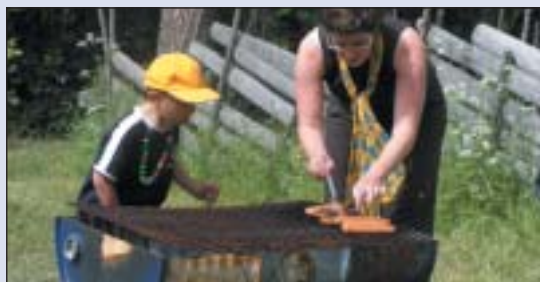
Her grilles dagens fangst.