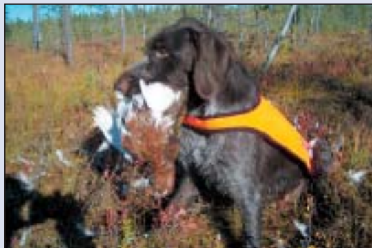
Apport trening kommer godt til nytte. Her strihår på jakt i Pasvik.

Apport trening og konkurranse er en både nyttig, morsom og spennende aktivitet som tydeligvis passer de fleste fuglehunder bra. Derfor burde flere trene mer apport for å stille opp på dette. Det avvikles ca. 26 prøver årlig fordelt på rene vann og spor og fullkombinert. De avvikles fortrinnsvis i sommerhalvåret. En av de største går i nærområde dvs. på Rasen sist i juli. Der er det også lag konkurranse. Medlemmer av Hed. Opp. er gode medhjelpere på denne prøven. Derfor hadde det vært moro om klubben også kunne stille eget lag. Det trengs bare 2 AK og 1 UK hund. Presenterer her kravene i henholdsvis UK og AK i håp om at flere lar seg inspirere til å delta, og at vi kanskje har et Hed.Opp. lag der i 2007!