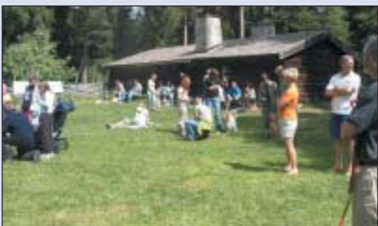
Stor trivsel under arrangementet.