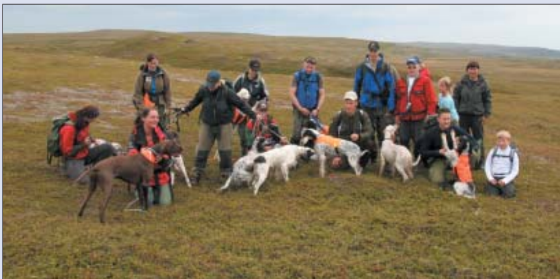
Flate finne vidder med bra rypebestand.