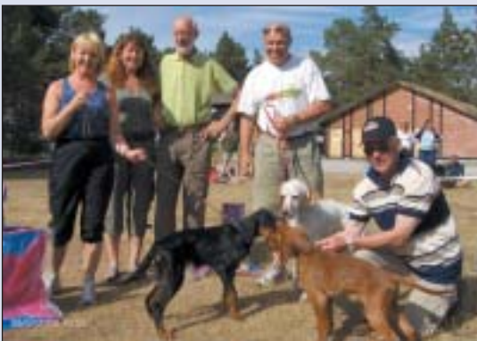
Rasespredning blant de beste ved valpeshowet.