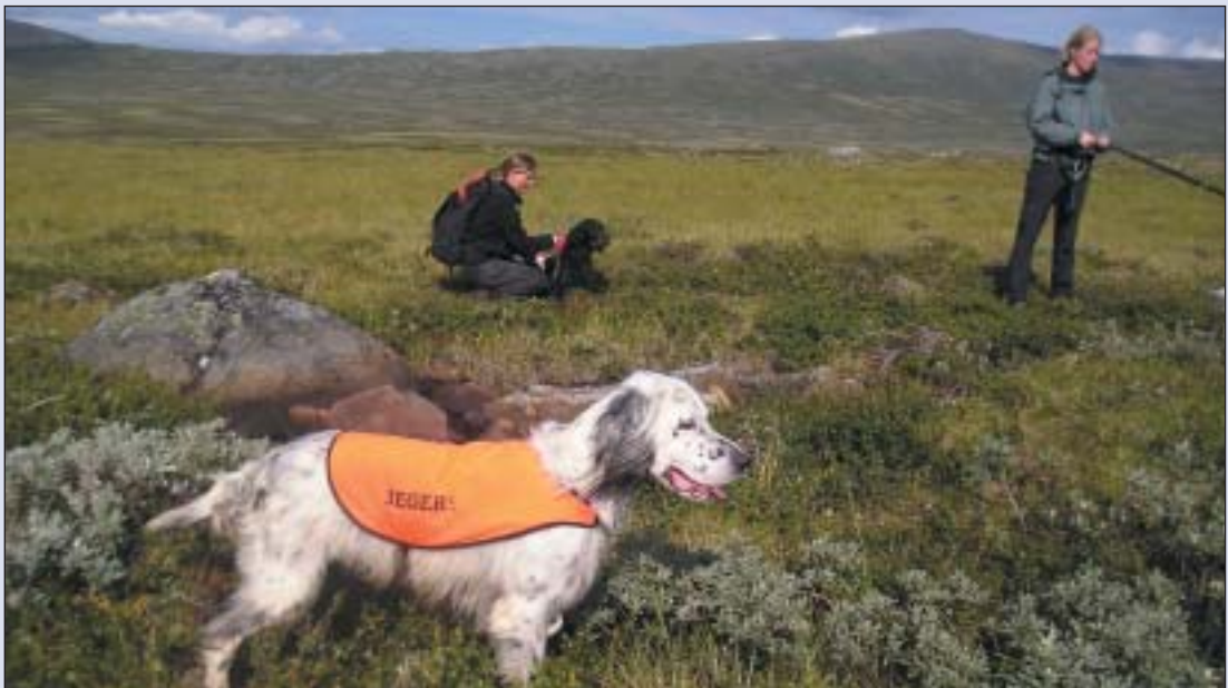
Vinsterfjellet Griff s"tar i stand og GS lord og Kim Tobbi leies opp.

Søndag morgen var det på nytt opprop for en ny dag og nye muligheter. Dessverre fikk jeg ikke selv vært med den dagen, da eldste jentungen har bursdag den 20. august. Men tilbakemeldingen fra søndagen, er det samme som for lørdagen. Komiteen så seg fornøyd med opplegget i år. Men som alltid, er det et problem i å få tak i nok