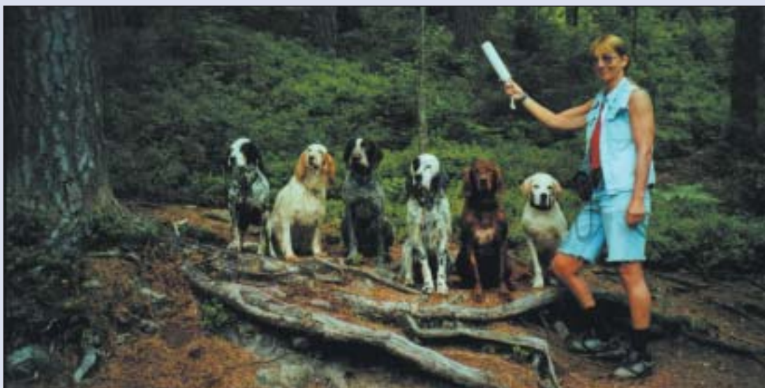
De fleste fuglehunder trives med apport trening . Undertegnede forbereder "sommer undervisning". – Apport i Mjåvatn.