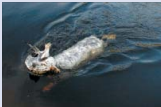
Mange av de engelske rasene elsker vann. Her engelsksetter under vannapport av måke.