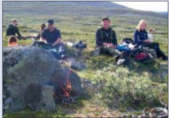
Kaffe og pølse kos i Veolia.

Lørdag kveld var det jegermiddag, jegergryte. Kaffe og dessert, med påfølgende med sosial samling i peisestua på Bessheim og det så da ut til at alle trivdes.