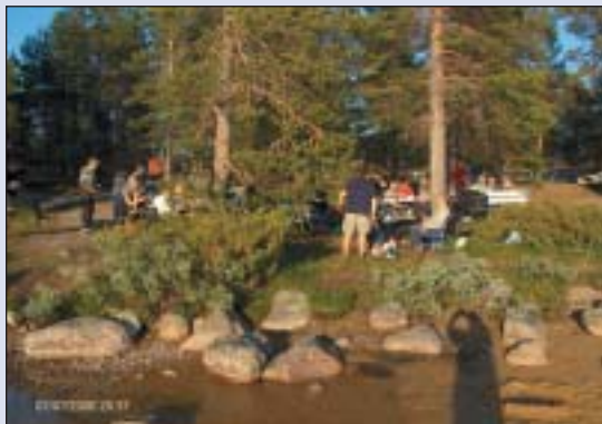
Flott grillplass ved Femund.