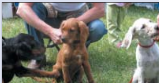
Gordon Setter, Irsk Setter, Engelsk Setter.